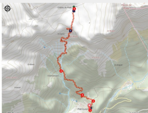
Les chalets de Platé (Lucie Rousselot - CEN 74)

Propulsion dans le Désert de Platé par un sentier escarpé.