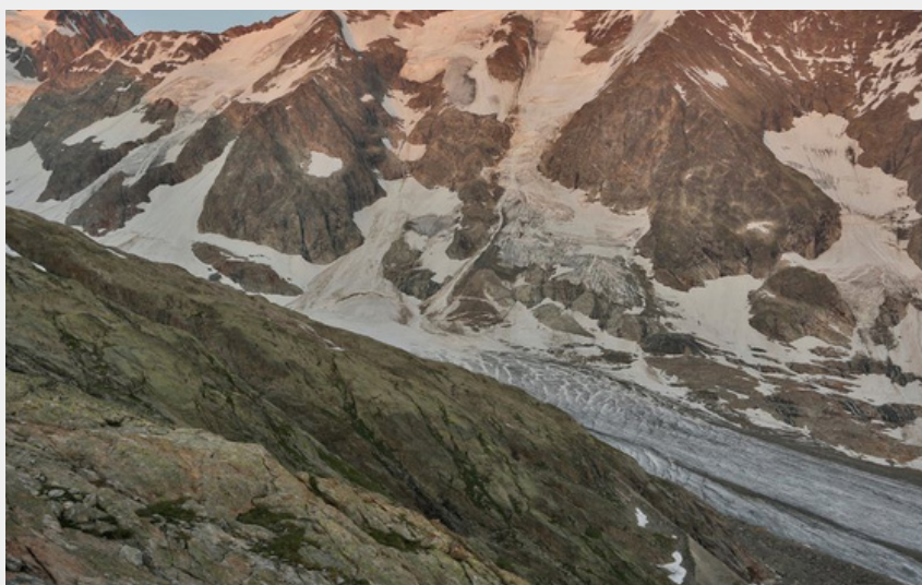
Coucher de soleil sur le glacier