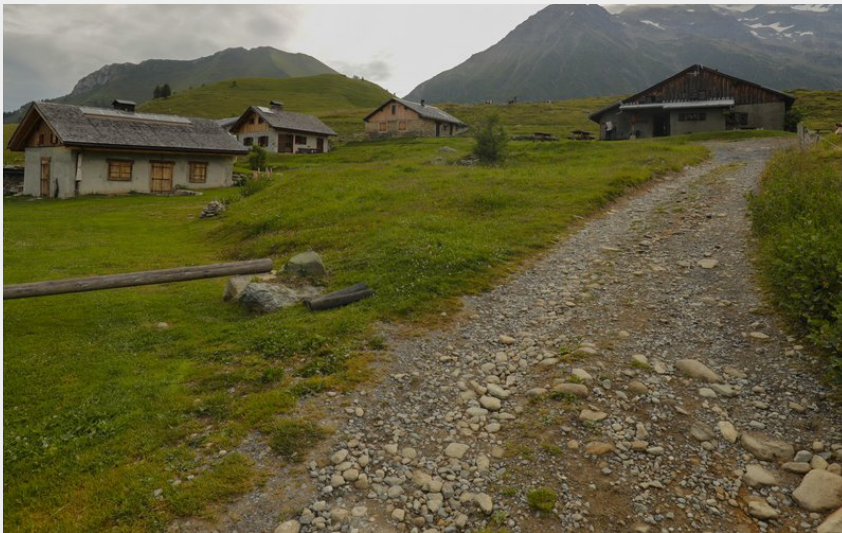
Chalets du Truc (Geoffrey Garcel - CEN 74)