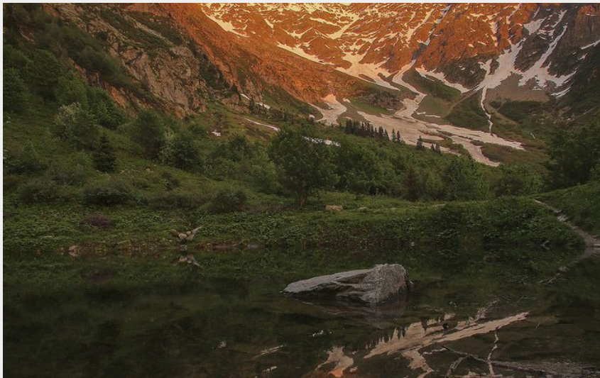
Lac d'Armancette (Teddy Bracard - CEN 74)