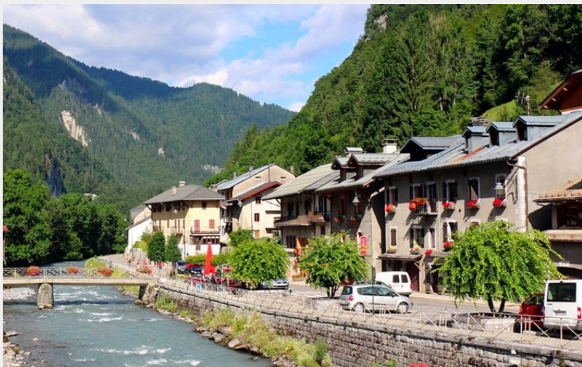
Village de Sixt-fer-a-cheval (@jeanLouis)