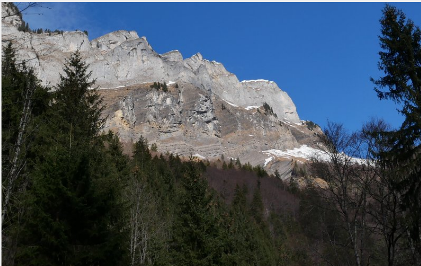
Pointe de Ressassat