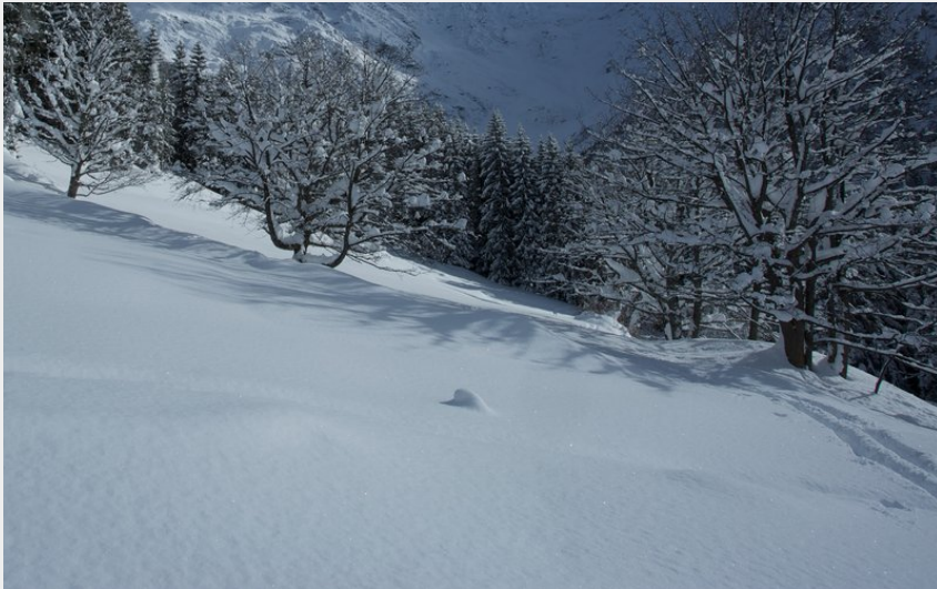
Bois de la crisette