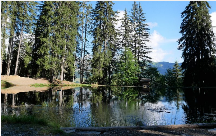
Lac des Evettes (@julietteBuret)