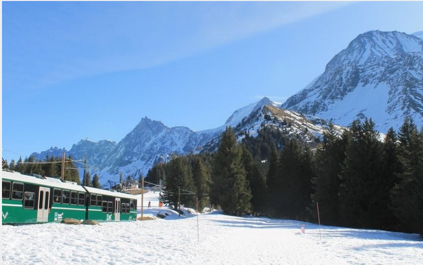
Tramway du Mont-Blanc