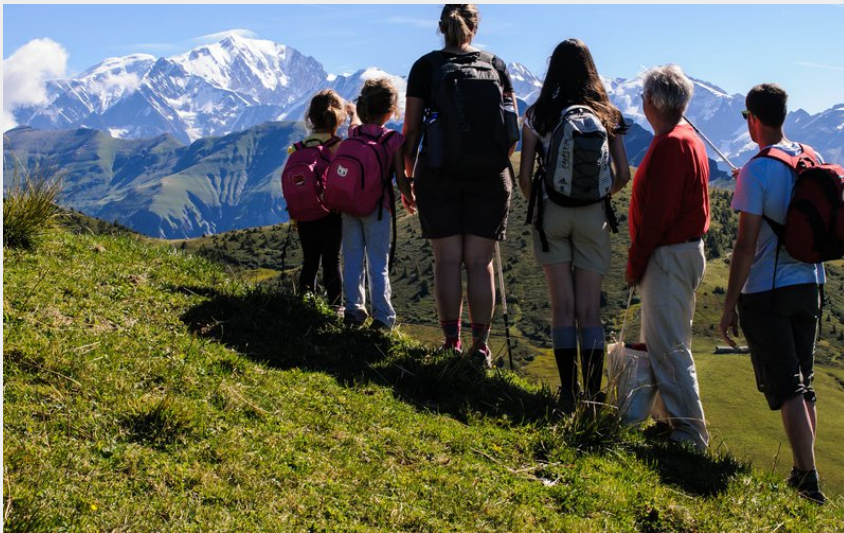
Randonnée famille Ban rouge